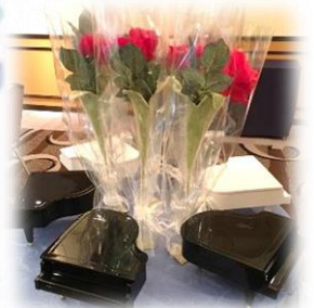
退任・就任記念品