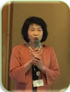
教育:ビブリオバトル(書面)