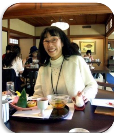
シリーズスピーチ 「第二のターニングポイント」