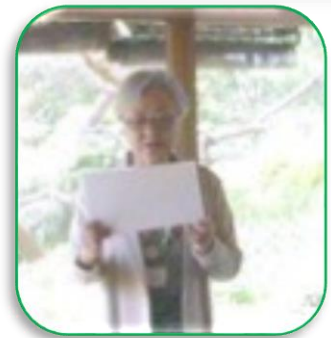
ITC - J 宣誓