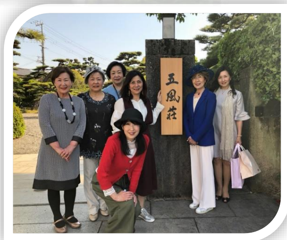
早朝からの役員会