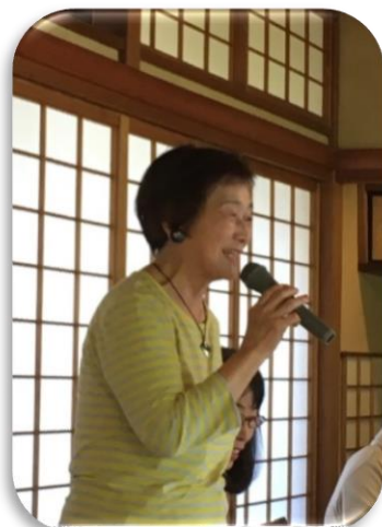
プログラムリーダー