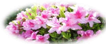
インスピレーション

「人に接する時は、暖かい春の心。 仕事をする時は燃える夏の心。考える時は澄んだ秋の心。 自分に向かう時は厳しい冬の心。」