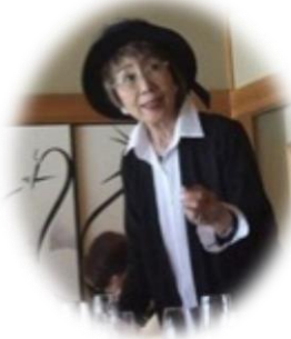
会員委員会委員長 お世話様でした！