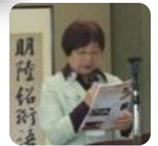
インスピレーション

幸運に恵まれたときも不運なときも断固として最善を尽くすことが 人生の意味を深めるだろう キングスレイワード「ビジネスマンの父より息子への 30 通の手紙」より