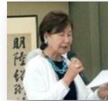
ミニ教育 「Ten チップス」