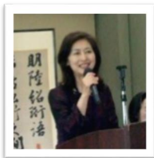
シリーズスピーチ ～継続は力なり～ 「キーボード」