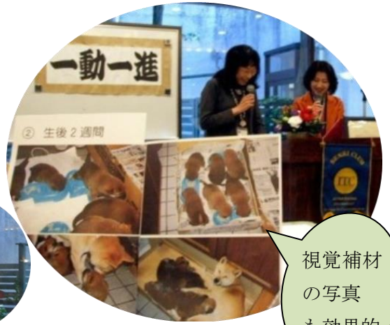
スピーチ → 対話による評価 *心温まるワンちゃんの出産、家族の絆も深まった