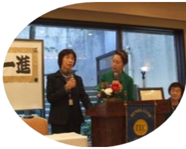
スピーチ → 対話による評価 *物忘れ!皆もうなずきながら・・・