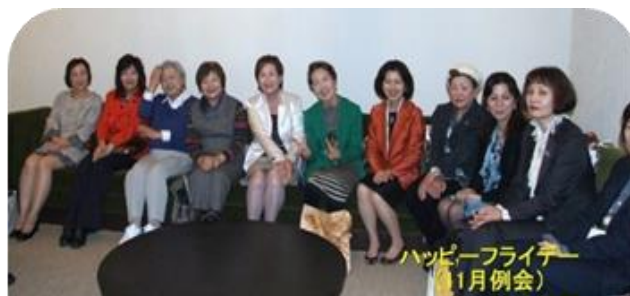
ハッピーフライデー (1月例会)

例会の後は HAPPY FRIDY 会員委員会がリードし ながら、話に花が咲き ました～♪