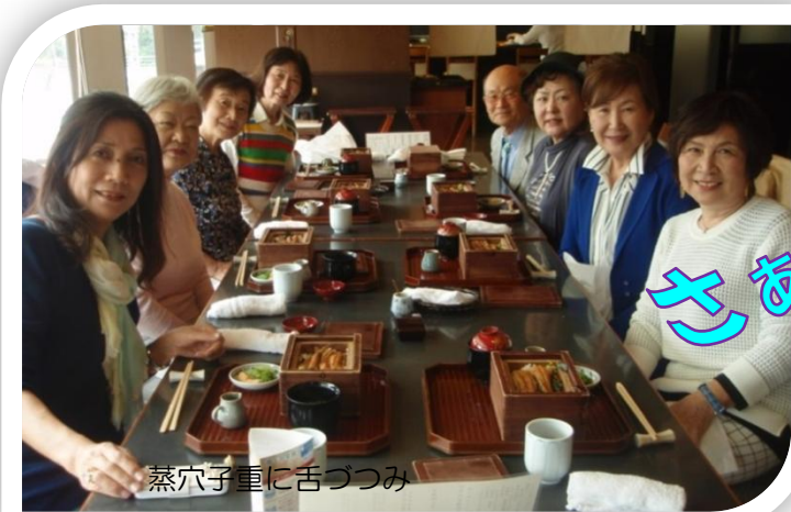
蒸穴子重に舌つつみ