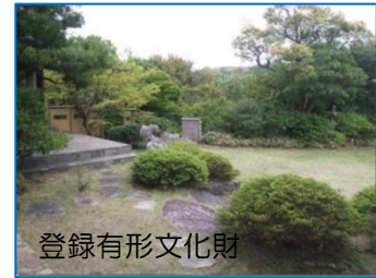
旧 木下 家 住 宅 国 登 録 有 形 文 化 財