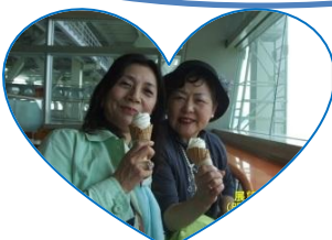
展望ラウンジで ご満悦