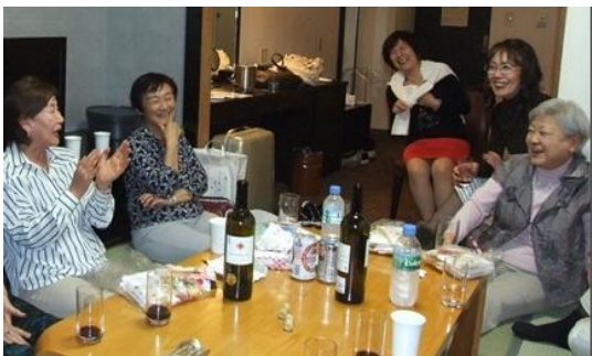
なれそめは？ それはね～。