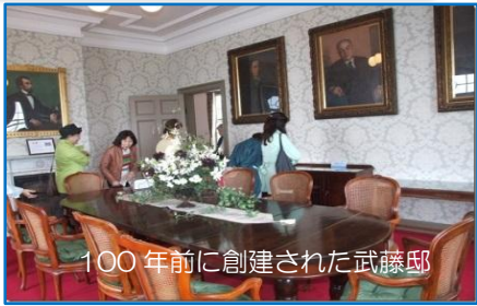
100年前に創建された武藤邸