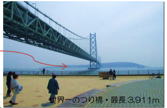
世界一のつり橋・最長 3,911m