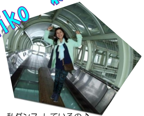
私ダンス しているの♪