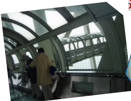
ハラハラドキドキ お手て つないで