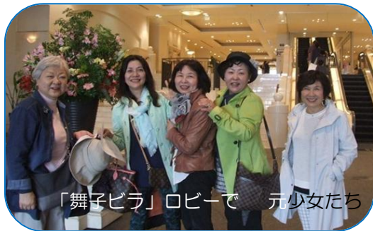
「舞子ビラ」ロビーで元少女たち