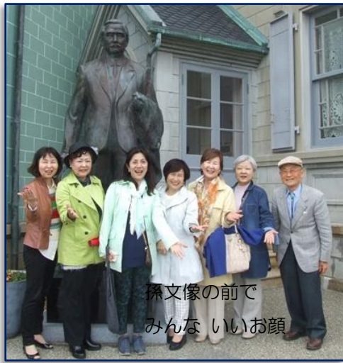
孫文像の前で みんな いいお顔