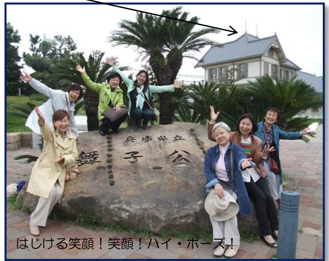
はじける笑顔！笑顔！ハイ・ポーズ！