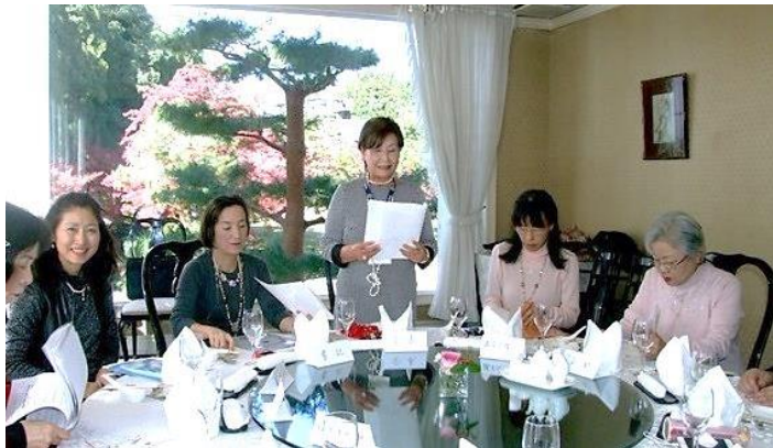
ビジネスもしっかりと